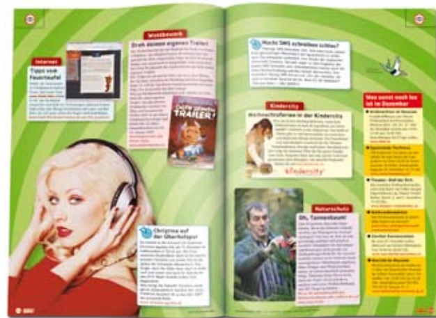
SZENE. Hier findest du Neuigkeiten aus der ganzen Welt – zu Film, Sport, Musik und, und, und ...