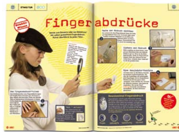
ETWAS TUN. Basteltipps, Rezepte und Experimente regen zum Mitmachen an.