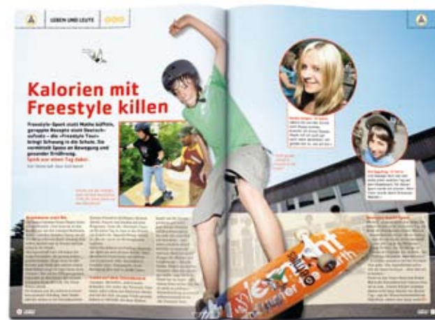
LEBEN UND LEUTE. SPICK zeigt, wie Kinder aus der ganzen Welt ihr Leben und ihren Alltag meistern.