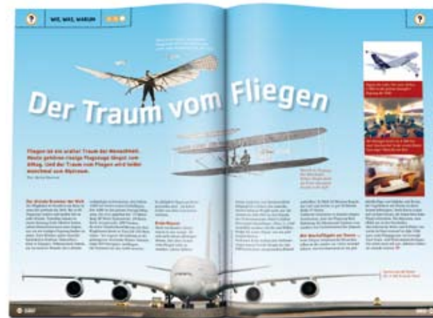
WIE, WAS, WARUM. SPICK erklärt dir auf einfache und verständliche Weise die Wunder der Technik und unserer Welt.