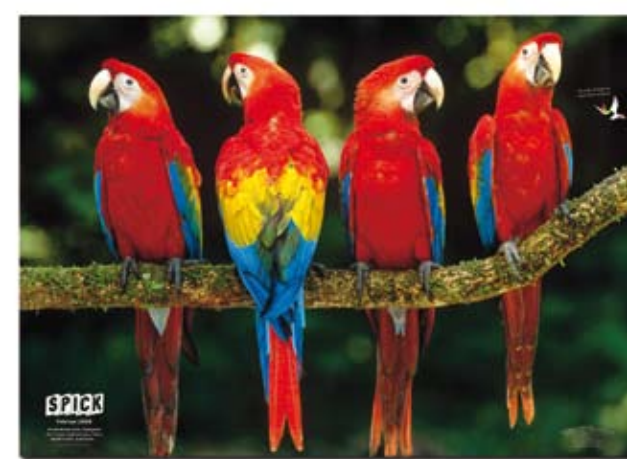
POSTER. Immer wieder liegt dem SPICK ein grosses Poster bei.

«Am SPICK gefallen mir die Spielvorschläge, die lustigen Witze und Comics. Und wenn der SPICK mit der Post kommt, verziehe ich mich alleine ins Zimmer, damit ich die spannenden Geschichten in Ruhe lesen kann ... »