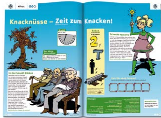
KNACKNUSS. Knifflige Rätsel für jedes Alter fördern das logische Denken.