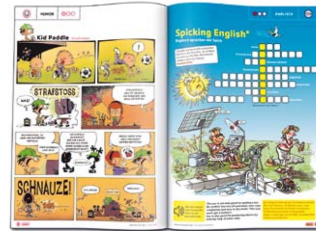
HUMOR. Leser-Witze und Comics erleichtern den Einstieg ins Lesen und machen Freude.