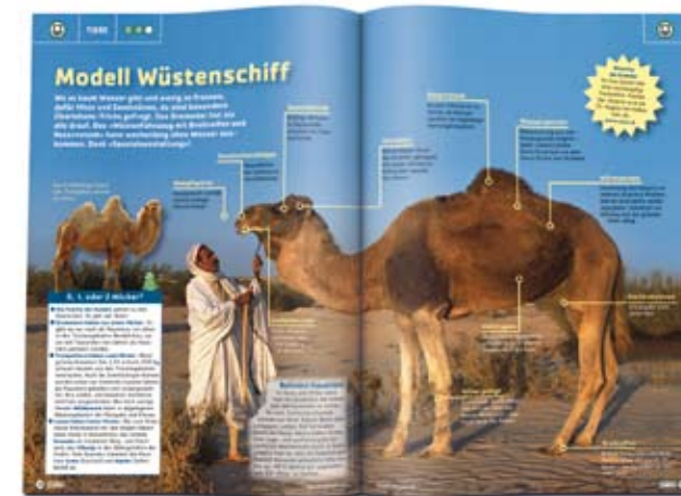
TIERE. Warum hat ein Kamel zwei Höcker? Kann eine Fliege husten? SPICK geht der Sache auf den Grund.